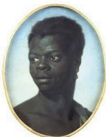
Portrait d'un jeune homme noir de Maurice-Quentin de La Tour, 1741, pastel