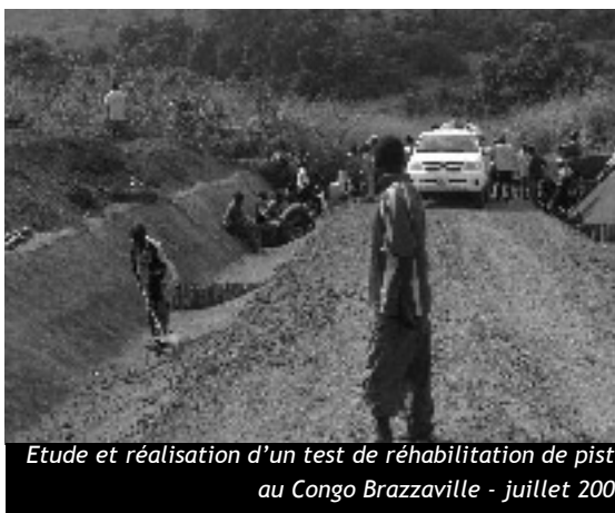
Etude et réalisation d'un test de réhabilitation de piste au Congo Brazzaville - juillet 2008

Forte de son expérience nationale et internationale, AGIRabcd-délégation régionale du Centre souhaite valoriser celle-ci en transposant à l'international les thèmes aujourd'hui développés en national et en mettant en commun avec d'autres