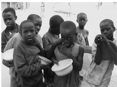
Enfants Talibés - Fatik - Sénégal