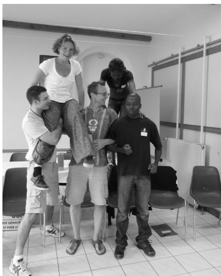
Jeux de « brise-glace » pour apprendre à se connaître, début du camp d'été Jeunes Adultes CCFD, Vosges, août 2009

Cette commission s'est réunie pour la première fois le 14 octobre 2009 à Orléans. Réunissant une vingtaine de structures différentes (associations d'éducation au développement, de solidarité internationale, des représentants du monde de l'enseignement et des institutionnels), cette rencontre a permis une première prise de contact, mais aussi de travailler à l'élaboration d'une définition commune de l'EAD.