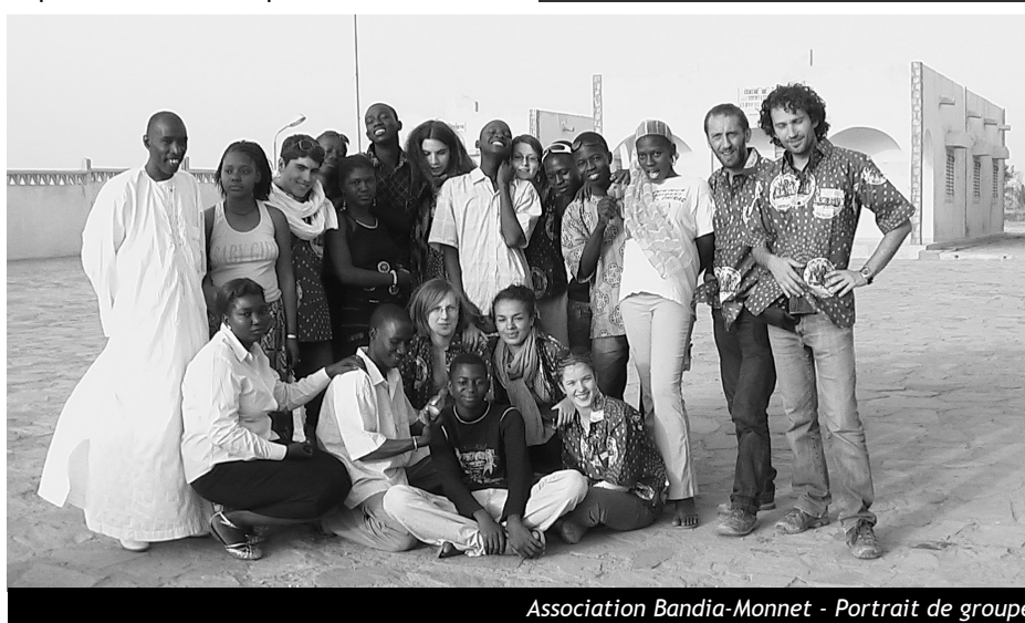
Association Bandia-Monnet - Portrait de groupe

[1] Pour lire cet article dans son intégralité et découvrir les différents projets pédagogiques menés dans le cadre de ce partenariat, rendez-vous sur www.centraider.eu , page Mali.